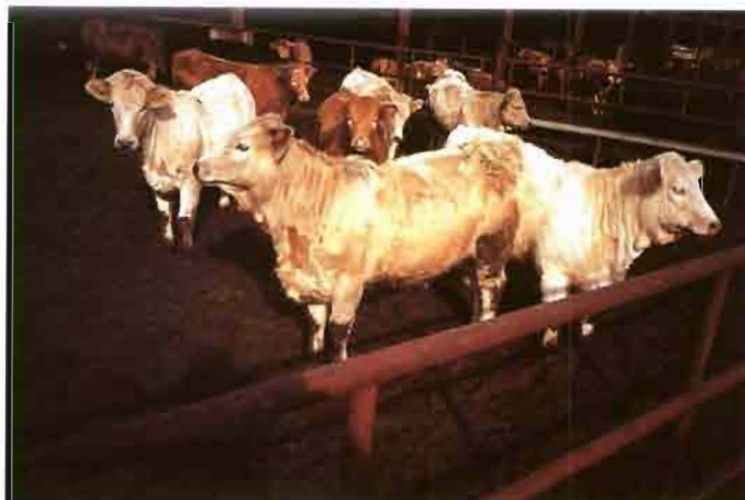
El cebo de terneros es una actividad poco frecuente en la región.