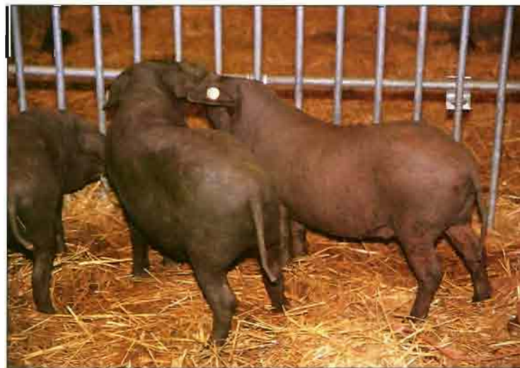
El cerdo ibérico, alimentado con la bellota y la hierba de montanera, produce unos productos de excelente calidad.