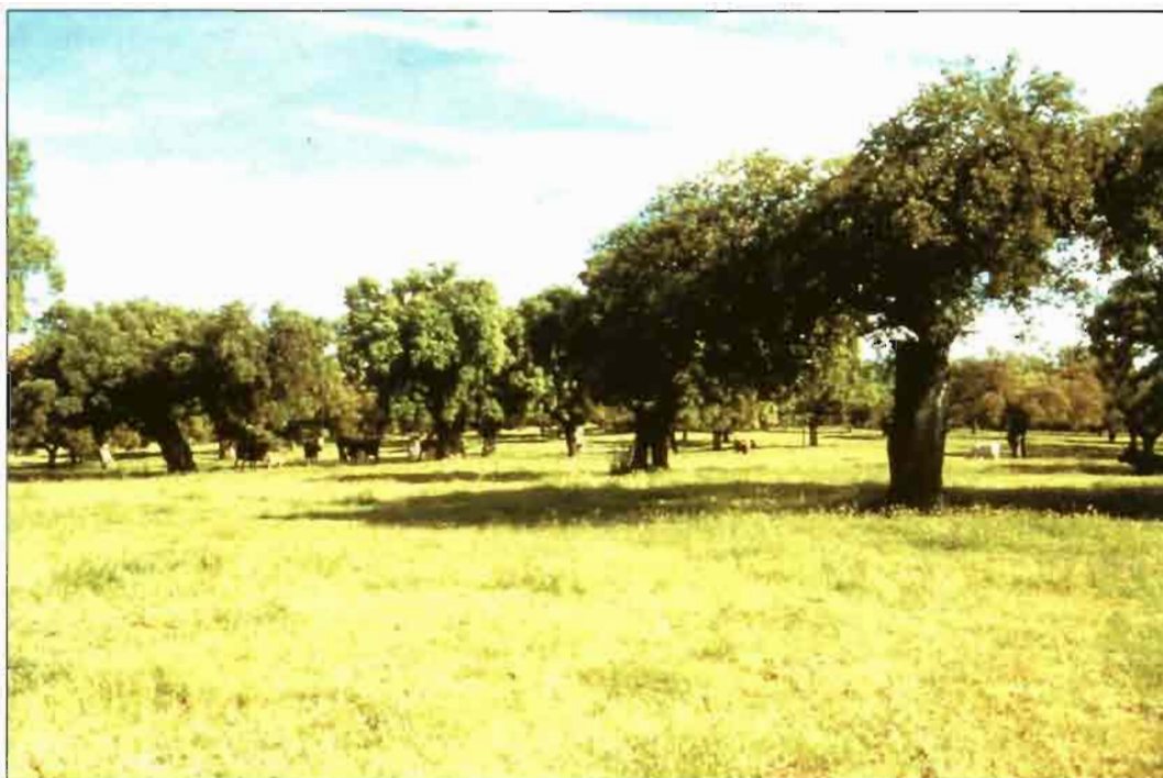
Dehesa arbolada en Extremadura.