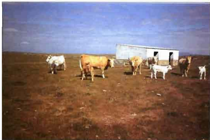
Vacas cruzadas Charolais x Retinta.