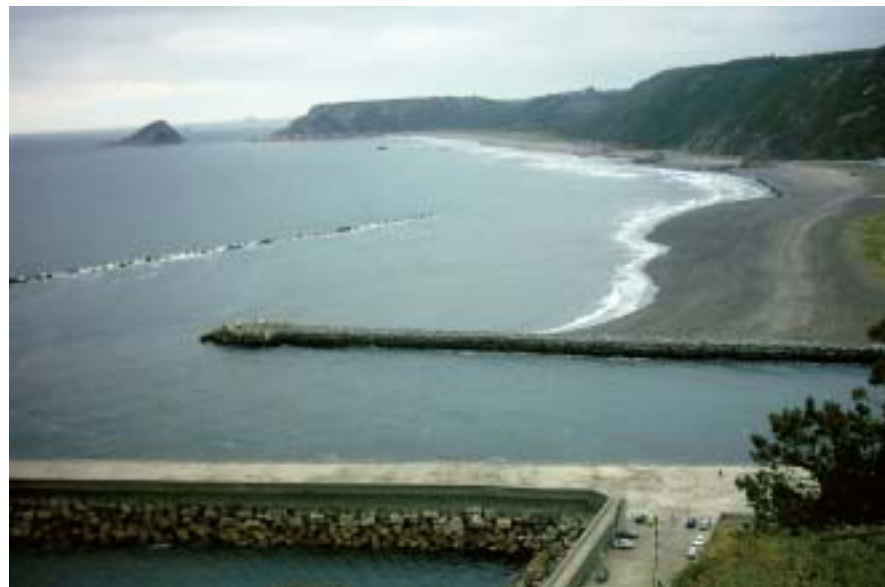
Desembocadura del Nalón.