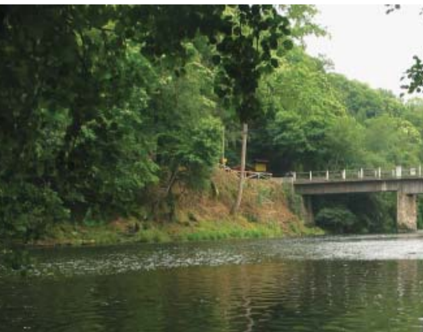
Puente de Quinzanas sobre el Narcea

Desde que el Programa PRODER se puso en marcha, la instalación de un centro de Alevinaje de Salmones promovido por “Las Mestas del Narcea”, en Quintana, en el río Aranguín, apuntó una opción que luego ha cuajado plenamente. Con PRODER 2 se han ampliado las instalaciones hidráulicas de toma, filtrado y depósito de reserva. Se crían también alevines de truchas y mediante la captura de reproductores, desove, fecundación y cría de alevines en la piscifactoría, se sueltan en invierno y en primavera preesguines, “pintos” por el color, que ya en el río se convierten en esguines plateados.