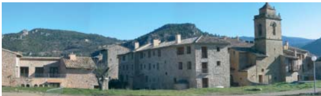
En Ligüerre, ha primado la rehabilitación frente a la nueva construcción.

ación de un centro de vacaciones para un turismo alternativo y popular; explotación de los terrenos para usos agropecuarios y creación de infraestructuras para usos sociales ligados a la promoción cultural de la comarca.