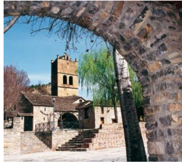
La iglesia de Morillo es hoy un centro social

El objetivo del sindicato era la recuperación integral del pueblo para usos turísticos, sociales y agropecuarios. Y, con ese fin, se pusieron en marcha tres proyectos complementarios: cre-