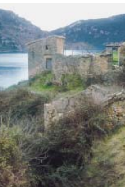
En 1986, UGT de Aragón solicitó a la Confederación Hidrográfica del Ebro la cesión temporal de Ligüerre de Cinca, abandonado en los años sesenta.

Unas 17 personas trabajan en Ligüerre todo el año y la cifra llega en verano al medio centenar. De esta forma, el proyecto de recuperación del pueblo promovido por UGT no tiene sólo el valor de rescatar un pueblo de las ruinas: contribuye, desde la valorización de los recursos turísticos, a dinamizar la comarca de Sobrarbe. 🍷