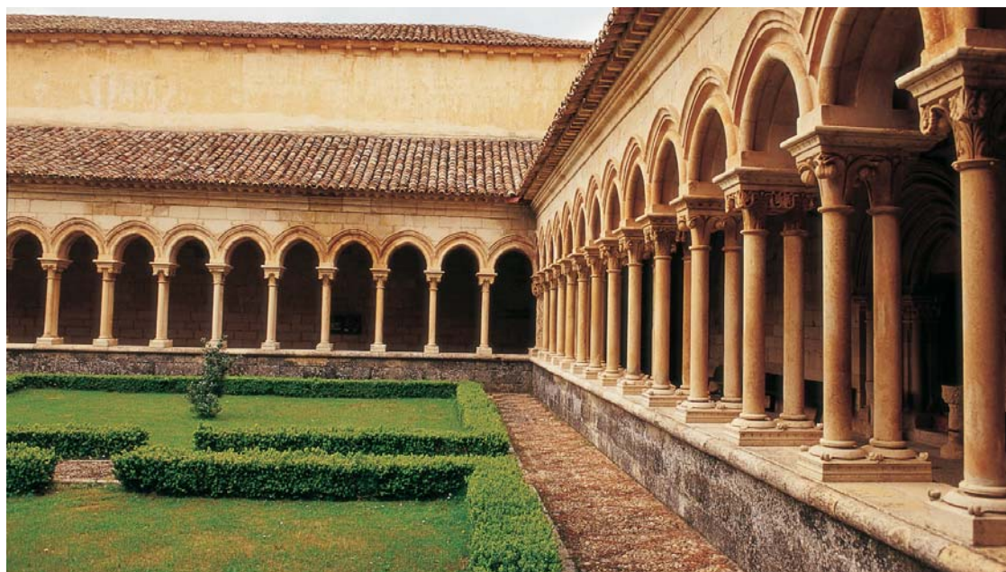
El patrimonio cultural une a municipios de Cantabria, Palencia y Burgos en el programa País Románico. Monasterio de San Andrés de Arroyo en Santibáñez de Ecla.

La naturaleza y el patrimonio cultural, que incluye las producciones tradicionales de la actividad agraria y artesana, constituyen la base en que confían estos territorios para mejorar su dinámica económica y social, con el fin de evitar un deterioro demográfico que llegue a ser irreversible. 🌿