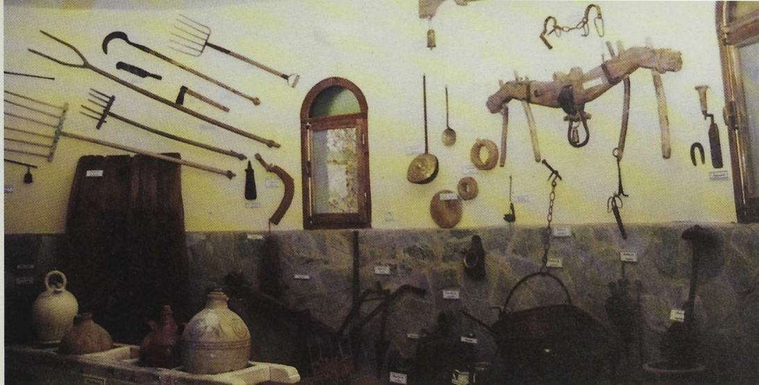
Museo etnográfico con herramientas y utensilios tradicionales en la Torre Atalaya

son exhibidos mostrando el pasado agrícola de estas tierras. La siguiente planta contiene una serie de paneles y maquetas que informan y representan los ecosistemas de la comarca, y por último, desde aquí, se puede acceder a un mirador panorámico donde se disfruta de una perspectiva incomparable.