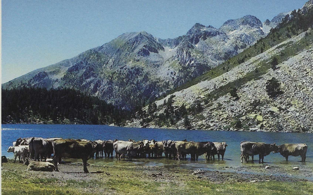
En las Jornadas se abordó el tema de la perspectiva medioambiental en los programas de desarrollo rural.

bientales en el territorio, y la introducción de módulos sobre medio ambiente en los programas formativos. Asimismo recordó la obligatoriedad de cumplir con la legislación medioambiental vigente, y recomendó la puesta en práctica de medidas de carácter voluntario, pero muy aconsejables en el nuevo marco del desarrollo rural, como la realización de buenas prácticas agrícolas, la implantación de sistemas de gestión ambiental y la participación de las autoridades ambientales de las comunidades autónomas en los comités de seguimiento.