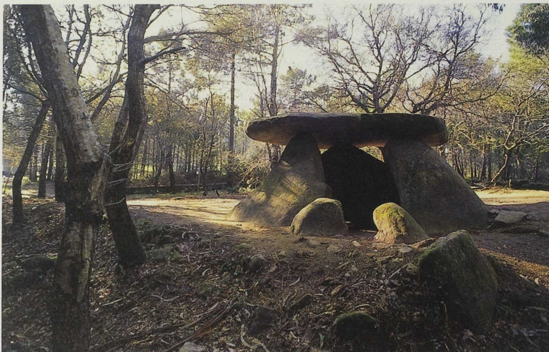
La conservación y valorización de los recursos culturales es uno de los aspectos prioritarios.