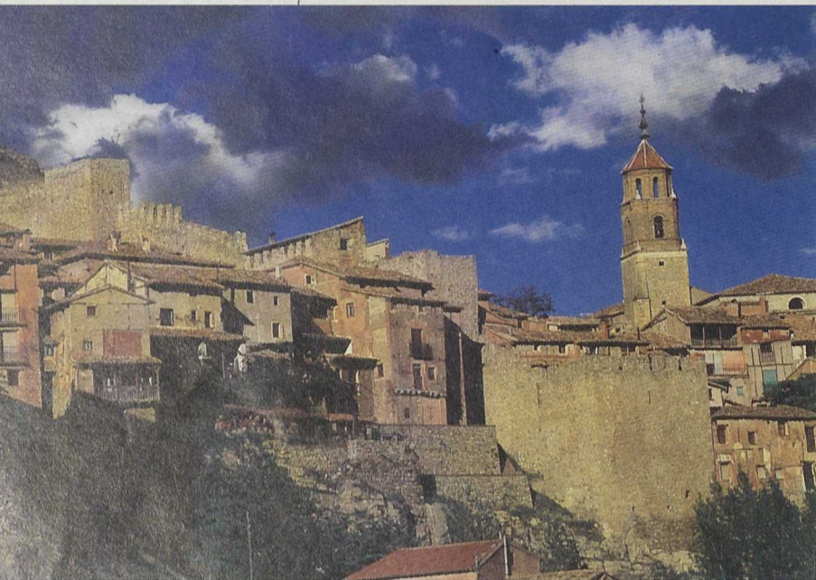
Hasta hace unos años, la actividad turística de la comarca se concentraba en la localidad de Albarracín.

En la actualidad, se han aprobado 60 proyectos, 17 de ellos en municipios con menos de 200 habitantes, 17 en municipios con más de 500 habitantes y 6 con más de 1.000 habitantes. Asimismo, destaca la creación de 6 pequeños hoteles con encanto, 4 en Albarracín y 2 en dos pequeñas poblaciones, un albergue con supresión de barreras arquitectónicas de 44 plazas en Rubiales y la puesta en marcha de una Red Municipal de Alojamientos Turísticos entre Torres de Albarracín, Saldón y Bezas. El proyecto impulsado por ASIADER ha trabajado en torno al incremento de la calidad de los alojamientos turísticos, en la creación de infraestructuras y di-