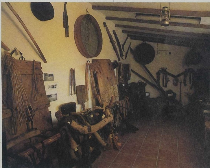
La mayoría de los promotores son jóvenes y es muy elevado el porcentaje de mujeres. Museo etnográfico en Rubiales.

Asociación para el Desarrollo Rural Integral de la Sierra de Albarracín Comunidad, 3. Tramacastilla. 44112 Teruel Telf. 978 70 61 98. Fax 978 70 60 59. E-mail: esar09@jet.es