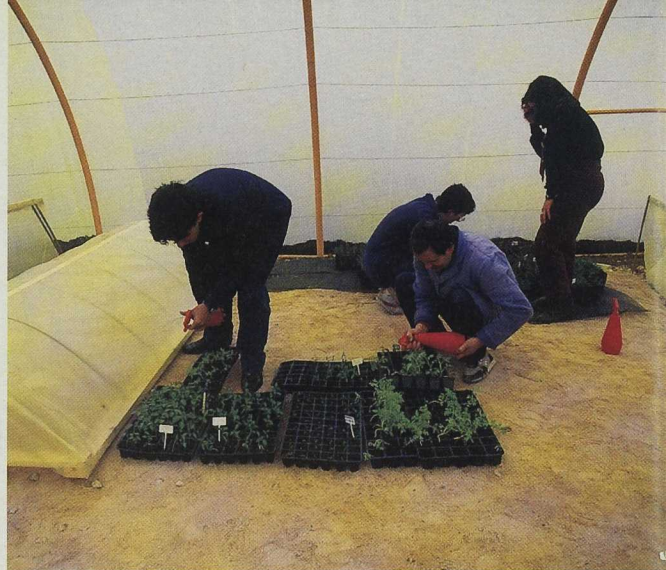
Se prestará especial atención a las inversiones en nuevas tecnologías, a las mejoras en la preparación y presentación de los productos