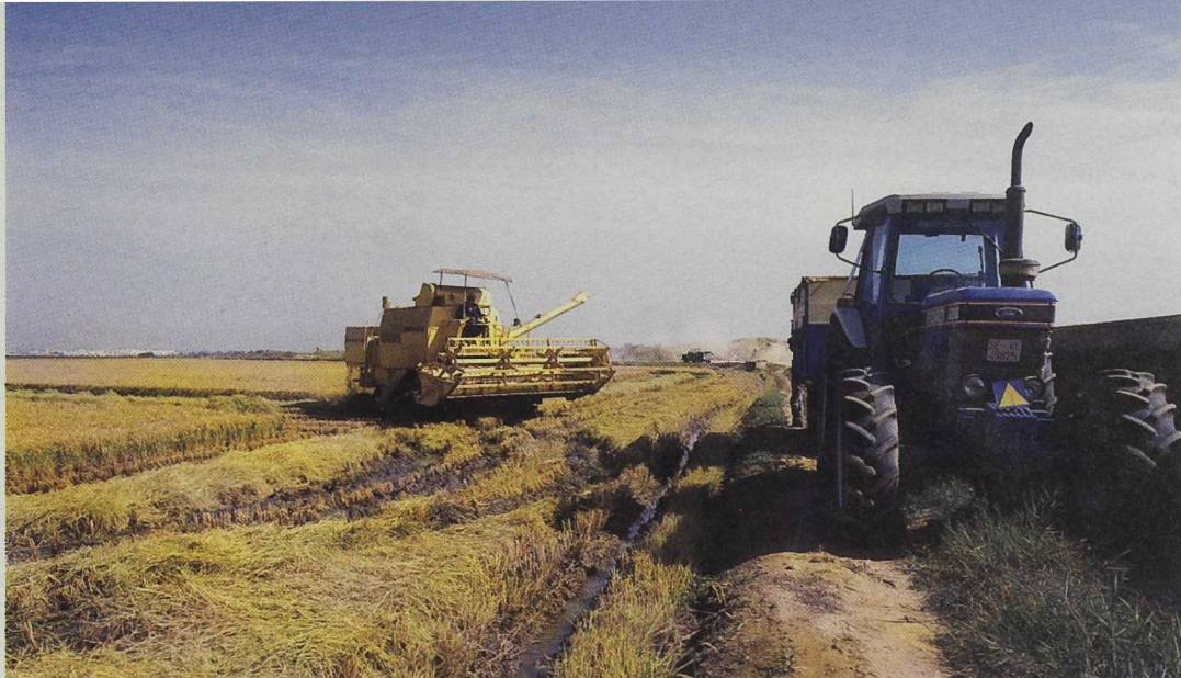
La indemnización compensatoria quiere contribuir al mantenimiento de las actividades agropecuarias en áreas clasificadas como desfavorecidas

incluyen: el cese anticipado de la actividad agraria, la forestación de tierras agrícolas, las medidas agroambientales, y las ayudas a las zonas desfavorecidas y otras con limitaciones medioambientales específicas (principalmente la indemnización compensatoria).