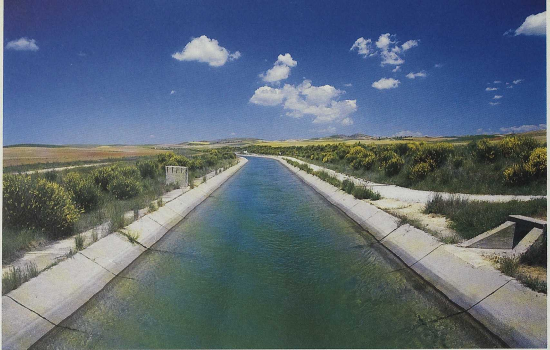
A la gestión de los recursos hídricos agrícolas se dedica un importante porcentaje de las inversiones.

superficies repobladas, y a compensar –durante 20 años– a sus titulares por la pérdida de rentas derivadas de la transformación.