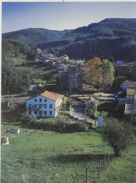
Se pretende que este proyecto sea el eje de desarrollo de la actividad turística de la comarca