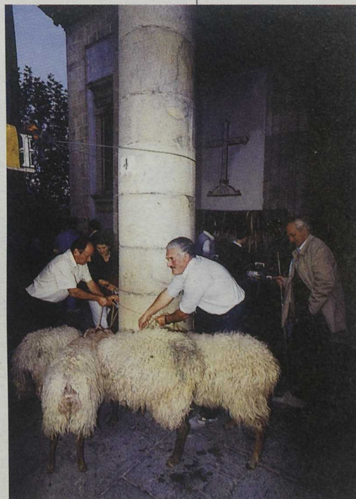
El comercio de la lana será evocado en el Centro dedicado a la actividad histórica del puerto fluvial

Asociación Grupo de Acción Local Comarca Asón-Agüera Antiguas Escuelas de Udalla. Ampuero 39850 Cantabria Telf. Fax 942 67 68 50. E-mail: ason@cantabriainter.net