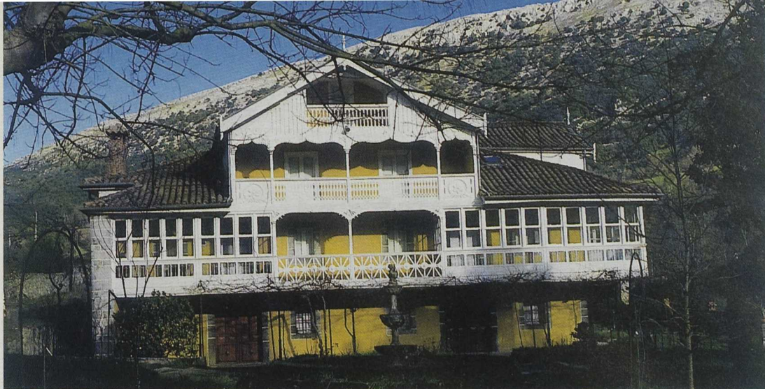
El legado de los indios, sus palacios y casonas, tendrá un espacio propio dentro de la red de centros

La denominación de los Centros y la temática que comprenderá será la siguiente: