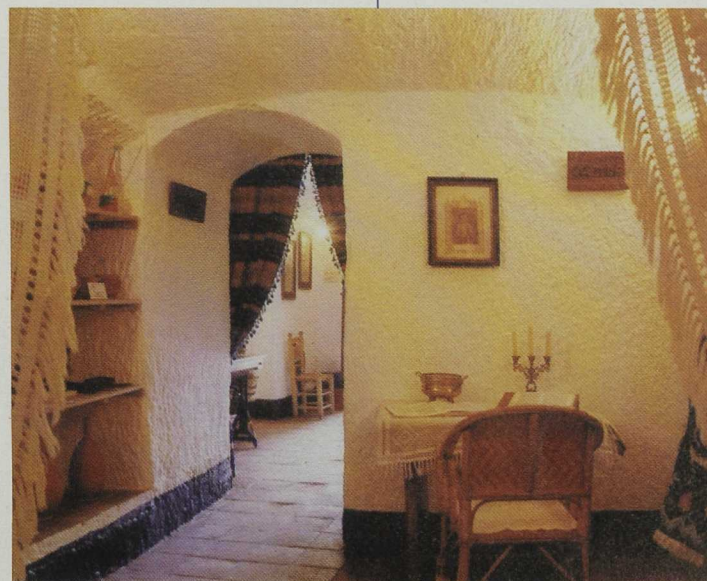
Las casas cueva de la comarca se están acondicionando como infraestructuras turísticas

LEADER Comarca de Guadix Plaza de las Palomas, s/n. Guadix 18500 Granada. Telf. 958 66 50 70. Fax 958 32 71 00 E-mail: guadix@cdrtcamos.es