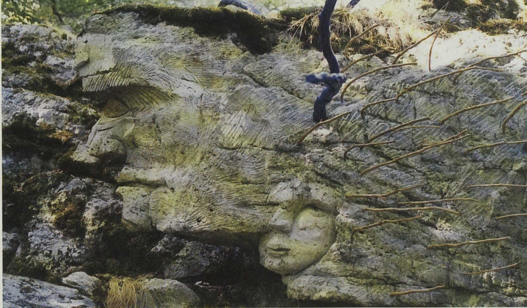
Las esculturas se han colocado en torno a la primera de las rutas señalizadas dentro del Parque Natural Sierra de Cebollera.