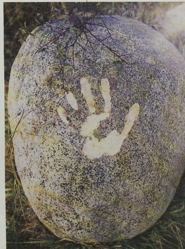
Cada año el Parque de Esculturas selecciona a 8 artistas internacionales para que lleven a cabo esculturas o intervengan en el espacio del parque.

Centro de Información y Promoción del Medio Rural CEIP - GAL La Rioja Miguel Villanueva, 7.1º i. Logroño 26001 La Rioja Tel. 941 23 07 33. Fax 941 25 89 04. E-mail: ceip@retemail.es