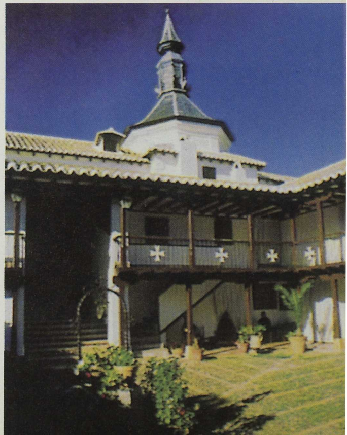
El proyecto se orienta a favorecer la presencia de visitantes y turistas durante todo el año. Villarubia de los Ojos.