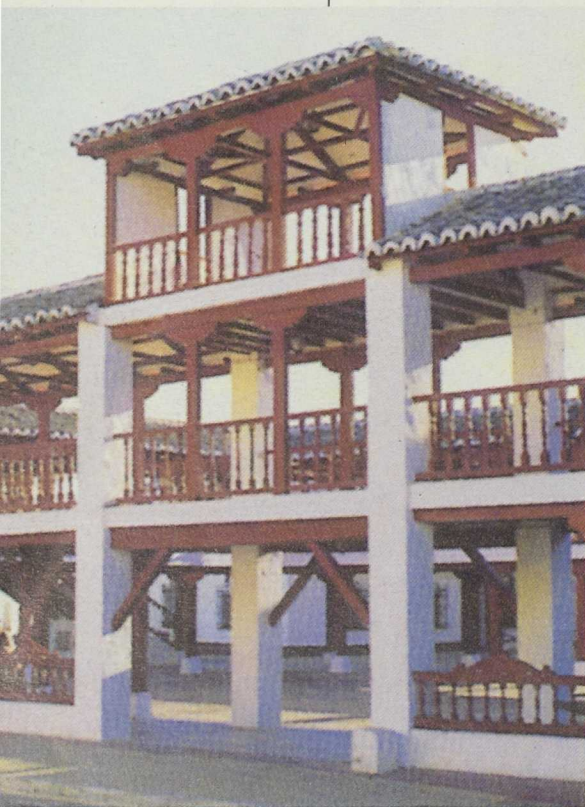
Telecentros y aulas telemáticas permitirán crear una red comarcal. Puerto Lápice.

En función de las posibilidades de cada una de las comarcas, se definieron las necesidades básicas para crear un centro de turismo de negocio. Se utilizaron los datos existentes sobre centros de teletrabajo y se definieron dos tipos de estructuras: