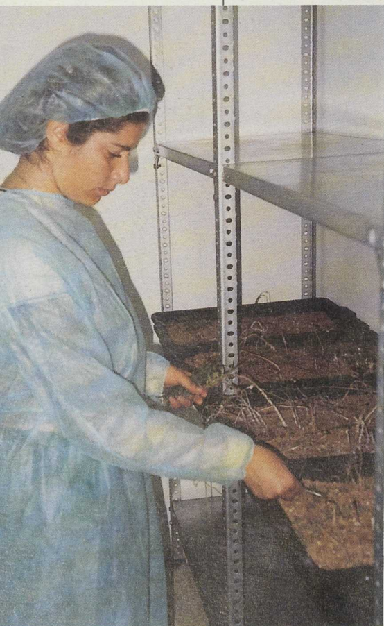
El LEADER comarcal ha apoyado diversas iniciativas para facilitar el acceso de las mujeres rurales al mercado laboral

La elevada participación de Asociaciones de parados, mujeres, jóvenes, culturales y de asistencia a drogodependencias ha sido uno de los aspectos más enriquecedores y destacados del PRODER de la Costa Occidental de Huelva. La puesta en marcha de pisos de acogida de drogodependientes, el impulso a la apertura de guarderías, el alojamiento para trabajadores temporeros, la búsqueda de estrategias innovadoras para la incorporación laboral de colectivos desfavorecidos son algunas de las iniciativas más destacadas.