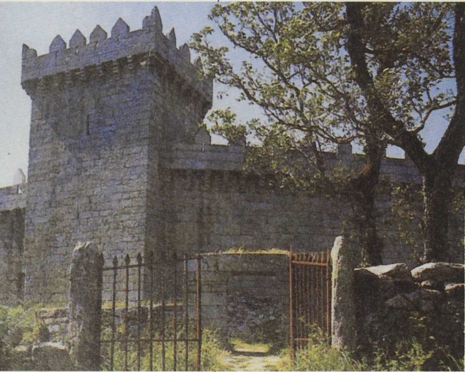
El patrimonio histórico de la comarca, su conservación y reutilización son objeto de un ciclo de conferencias. Castillo de Vimianzo

Bajo el epígrafe "Descubriendo milenios", el Grupo LEADER de la Costa da Morte ha puesto en marcha un ambicioso programa que, a través de charlas y conferencias, vídeos y publicaciones, quiere divulgar entre la población la historia, el arte, las manifestaciones culturales, las tradiciones, la artesanía, los recursos naturales ... de la comarca. Un primer paso para contribuir a la valorización y conservación de un patrimonio común como pilar de las estrategias de desarrollo.