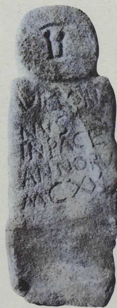
La valorización del patrimonio cultural común exige previamente que la población lo conozca y lo sienta como parte de su identidad

Asociación Neria Buenaventura Castro-Rial, s/n. Cee 15270 A Coruña Telf. 981 70 60 28. Fax 981 70 62 97. E-mail: asocneria@jet.es