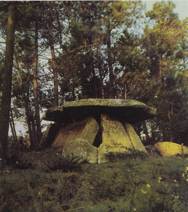
El patrimonio megalítico de la Costa da Morte recibe una especial atención. Dolmen de Dombate (3000 a de C).