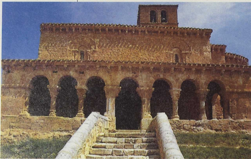
La firma de un convenio de colaboración económico con el Obispado de Osma-Soria, permitirá restaurar un conjunto de iglesias y ermitas. Iglesia de San Miguel, San Esteban de Gormaz

Aprovechando la conmemoración en 1999 del IX centenario de su muerte, la Asociación Tierras Sorianas del Cid junto con Adema (entidad que gestiona la Iniciativa Leader II en la zona Sur de la provincia de Soria) pusieron en marcha un ambicioso programa cultural que abarcó buena parte de las manifestaciones artísticas. Cine, teatro, música, mercados, exposiciones, conferencias, cursos, etc., inundaron las plazas de nuestros pueblos, con motivo de esta efeméride, en un intento por recuperar nuestra memoria viva y hacer un homenaje al Cantar de Mío Cid, en el que se recoge la azarosa vida de este personaje mitad historia, mitad leyenda. Ambas Asociaciones firmaron además un convenio de colaboración con la Universidad de Valladolid para la realización del Plan Director "El Cid en tierras de Soria", en el que se proponen un conjunto de actuaciones a nivel patrimonial y paisajístico en el amplio territorio cidiano de la provincia de Soria, que puedan contribuir a la cre-