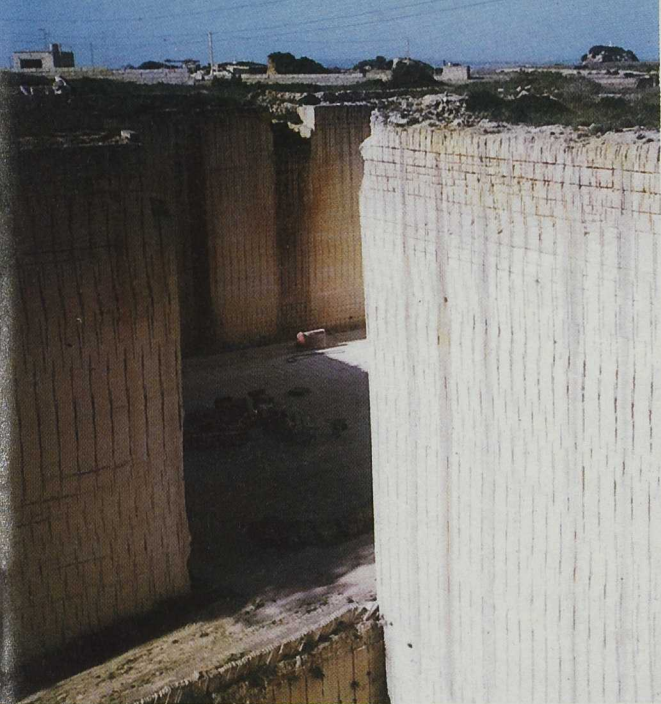
El espectacular espacio de las canteras ya ha sido utilizado para celebrar conciertos al aire libre