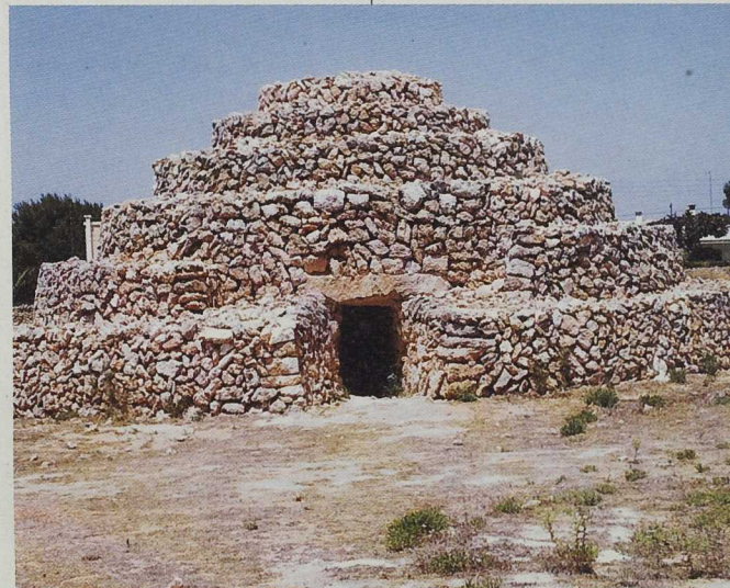
El marés fue usado por el hombre para levantar los monumentos megalíticos y hoy en día es muy apreciado por sus cualidades constructivas

Grupo de Acción Local LEADER de Menorca Cami des Castell, 28. Mahón 07702 Baleares Telf. 971 35 25 02. Fax 971 35 25 16