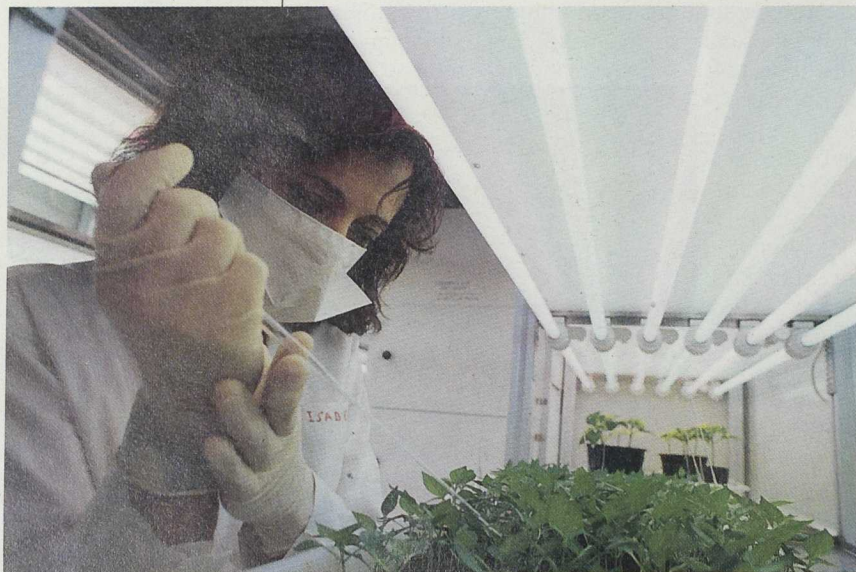
La estrategia de desarrollo potenciará la utilización de nuevos conocimientos y tecnologías a fin de incrementar la competitividad de los productos y servicios de los territorios.

Cada uno de los cuatro aspectos aglutinantes son lo suficientemente amplios como para per-