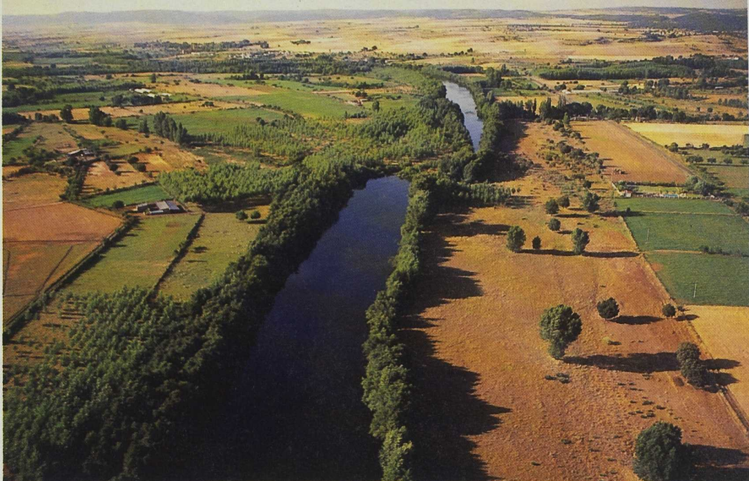
Los territorios seleccionados bajo LEADER+ estarán obligados a trabajar en red.

de la cooperación ésta podrá ser de carácter interterritorial (entre GAL dentro del mismo estado), o transnacional (entre GAL pertenecientes a dos o más estados). En este segundo caso también será posible la cooperación con territorios rurales no pertenecientes a la UE, pero aquí sólo se financiará la parte correspondiente al territorio LEADER+.