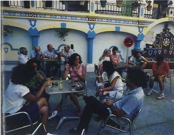
Los colectivos de jóvenes y mujeres reciben un apoyo especial.