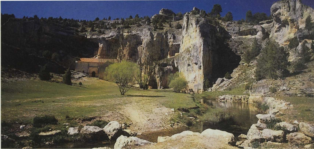
Una región fuertemente ruralizada.

aunque finalizado el plazo para solicitar ayudas a los GAL por parte de los promotores, seguirán verificando las distintas actuaciones hasta el 31 de diciembre de 2001 y es previsible alcanzar con el Programa Regional una inversión final total de más de 25.000 millones de pesetas. Se está aplicando en 669 términos municipales y en una superficie de 29.934 Km 2 . La población de este territorio es de 360.108 habitantes y su densidad media es de 12,0 Hab./Km 2 . En porcentajes regionales se está interviniendo sobre el 29,7% de los municipios, sobre el 31,8% de la superficie y sobre el 14,1% de su población. El incremento en términos municipales, de la iniciativa LEADER II sobre la iniciativa-piloto LEADER, ha sido espectacular, el 154,4%, pero la superficie sólo ha aumentado un 45,6%. Con respecto a la población afectada ésta se ha incrementado un 72,7%. Hay que concluir, pues, que la expansión en este período se ha nutrido principalmente de municipios pequeños y con poca población.