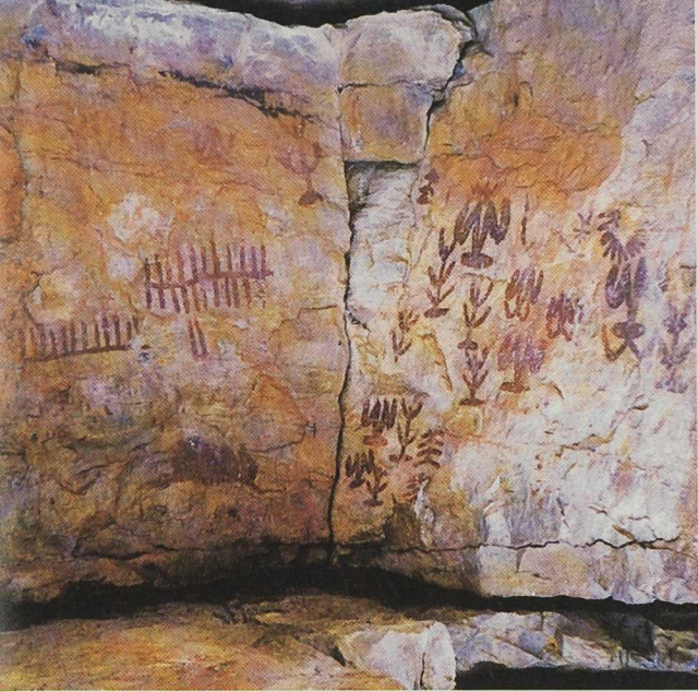
Pinturas rupestres, minería y arqueología, recursos naturales y trashumancia constituyen los recursos turísticos estratégicos

tros pueblos se ajusta a un modelo de ordenación territorial que responde a los fuertes estrangulamientos y problemas detectados (falta o mal estado de infraestructuras y equipamientos para la motivación y dinamización social, o la debilidad u obsolescencia de los instrumentos de gestión - urbanísticos, inventarios de caminos, derechos y bienes, ordenanzas, etc...-), los cuales estaban conduciendo a una continua degradación del entorno, y a los que se les ha prestado especial atención desde el Programa.