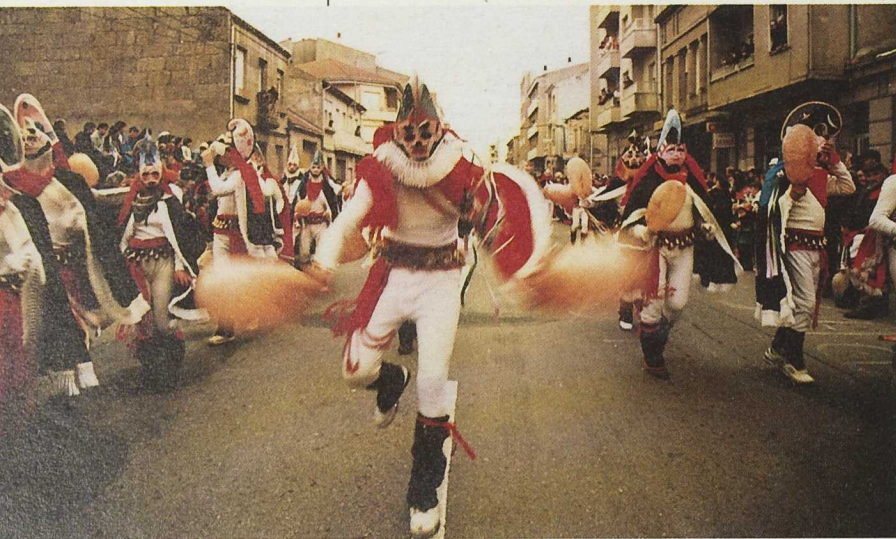
El Entroido de Xinzo de Limia

Desde el LEADER se han potenciado éstos y otros elementos de atracción turística y fomentado iniciativas complementarias para diseñar una oferta integral de la comarca. Así, desde la Asociación para el Desarrollo Integral de Val do Limia (ADIM) se estimuló la rehabilitación de construcciones populares para convertirse en alojamientos y mesones rurales que se acometerán con el programa, y se destinan fondos para la adecuada formación de los promotores. Se imparten cursos de inglés turístico, agentes turísticos; aprovechamiento de recursos endógenos, gestión hotelera, sistemas de calidad para establecimientos turísticos, cocina y recuperación de platos tradicionales.