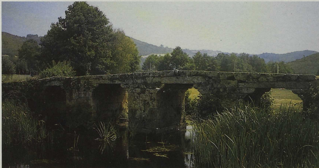
Puente rústico sobre el río Faramontaos, en Xinzo de Limia

Asociación para el Desarrollo Integral de Val do Limia Santa María la Real, 39. Entrimo. 32860 Ourense Telf 988 42 10 79. Fax: 988 42 11 71