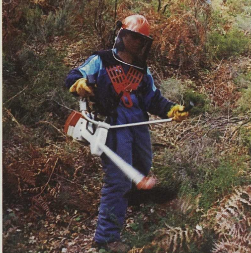
El Curso de Trabajadoras Forestales Cualificadas ha permitido a cinco mujeres unirse y crear Rajamanta