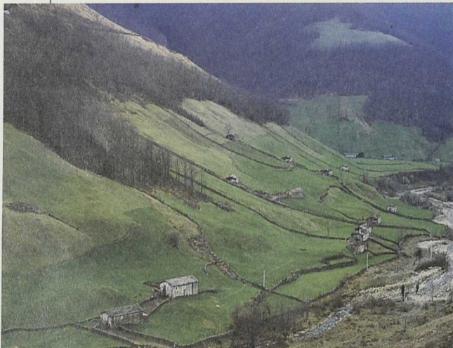
El carácter piloto de las experiencias es una de las grandes cuestiones de LEADER +

La experiencia PRODER en nuestro país ha facilitado notablemente la transferencia y reajuste de la experiencia para la expansión de la filosofía LEADER a otras políticas y sectores.