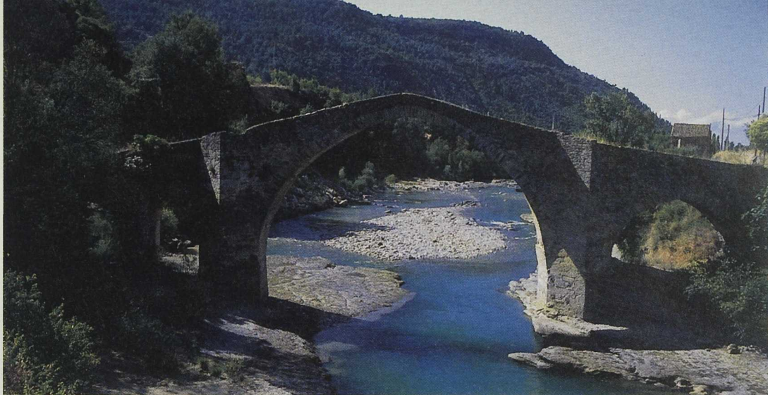
El turismo rural ha acaparado un gran número de proyectos.

sidad a disposición de los nuevos Grupos sus experiencias y conocimientos acelerando así sus dinámicas de desarrollo. De esta forma los 6 Grupos que habían sido seleccionados para la medida de Adquisición de Capacidades estuvieron preparados en sólo un año para iniciar la de Innovación Rural.