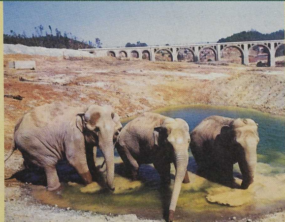
El Castillo de las Guardas, una antigua zona minera, acoge a fauna salvaje en semilibertad

La empresa Zoosafari, con larga experiencia en este sector, encuentra en las antiguas estructuras de las minas de El Castillo de las Guardas un singular paisaje con múltiples posibilidades pa-