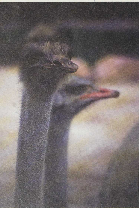
Con el apoyo del LEADER se han instalado en la comarca tres granjas para la cría del avestruz

De hecho, estas granjas suponen una plataforma para diversificar la economía de la zona, al tiempo que ramifican la actividad ganadera, y auguran un futuro de transformación bastante importante, pues favorecerán en su entorno la aparición de manufacturas de la piel, tratamiento de las plumas, fabricación de embutidos, mataderos especializados..., atrayendo nuevos inversores.