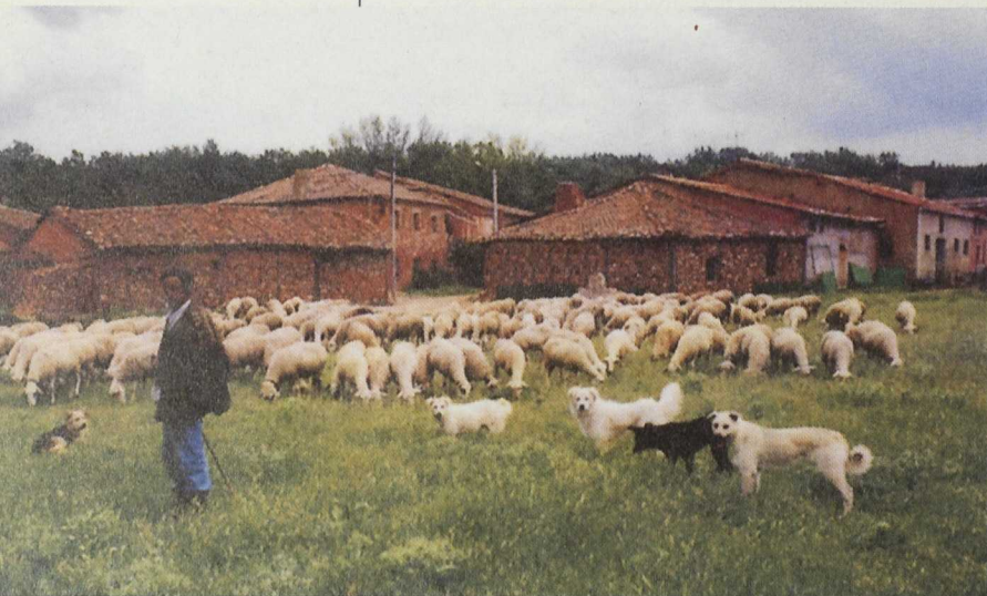
Hasta la llegada de la Iniciativa LEADER, la actividad económica tenía como principales pilares la agricultura y ganadería

El municipio de Campo de San Pedro fue parte importante en la gestación del proyecto de desarrollo LEADER II que promovió CODINSE para todo el nordeste de Segovia. Desde un primer momento este Ayuntamiento prestó todo su apoyo al GAL, que terminó por instalar su sede en la localidad.