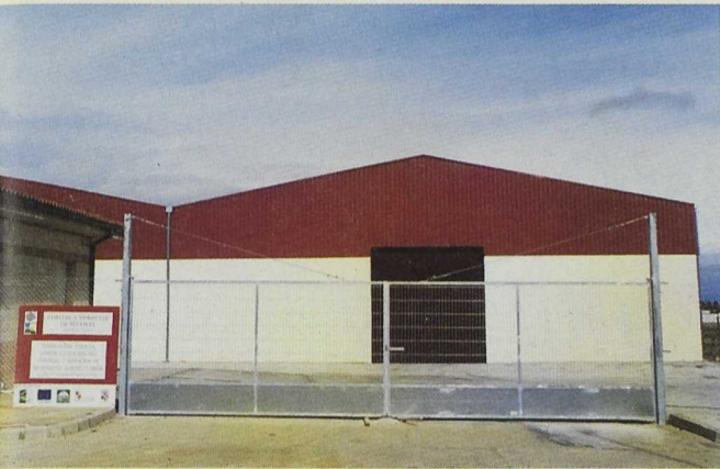
Las subvenciones para instalarse en el nuevo polígono han animado ya a algunas empresas

La corporación siempre consciente de la necesidad de aumentar los servicios, generar empleo y en última instancia aumentar su población, apostó por la instalación de nuevos servicios e industrias. Para ello el Ayuntamiento, en locales municipales infrautilizados, creó un vivero de empresas donde se fueron instalando empresas de servicios, como una gestoría, un despacho de ingeniero agrónomo, la edición del periódico comarcal, un despacho de ingeniero de caminos, la oficina de correos, y una dentista. Para favorecer, además, la instalación de industrias, emprendió la adecuación del suelo industrial municipal, proyecto éste que se ha financiado con los fondos LEADER.