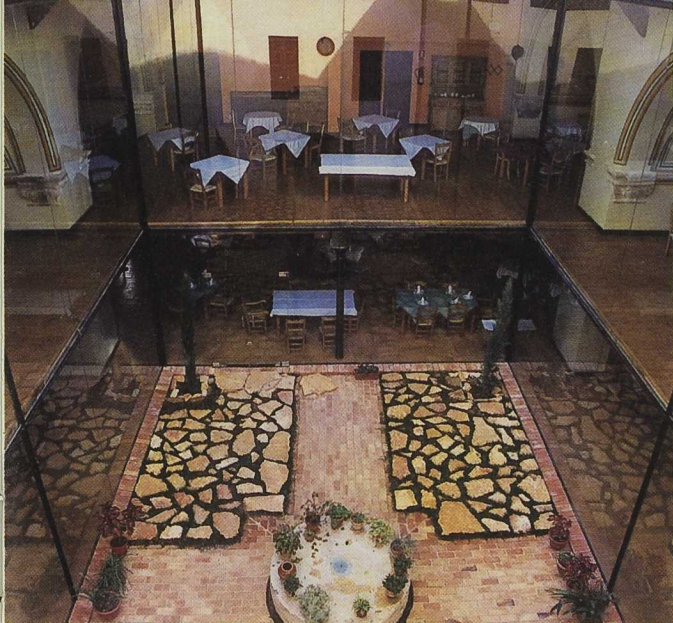
El sector turístico crece de forma sostenida y tiene grandes posibilidades de desarrollo. Hotel en un antiguo convento del siglo XVII.