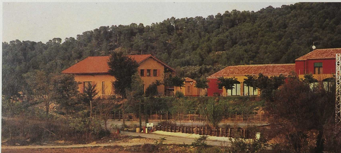
El hotel Parada de Compte ocupa una antigua estación de ferrocarril.

Se crean infraestructuras turísticas de calidad y al mismo tiempo se rehabilitan lugares de interés patrimonial