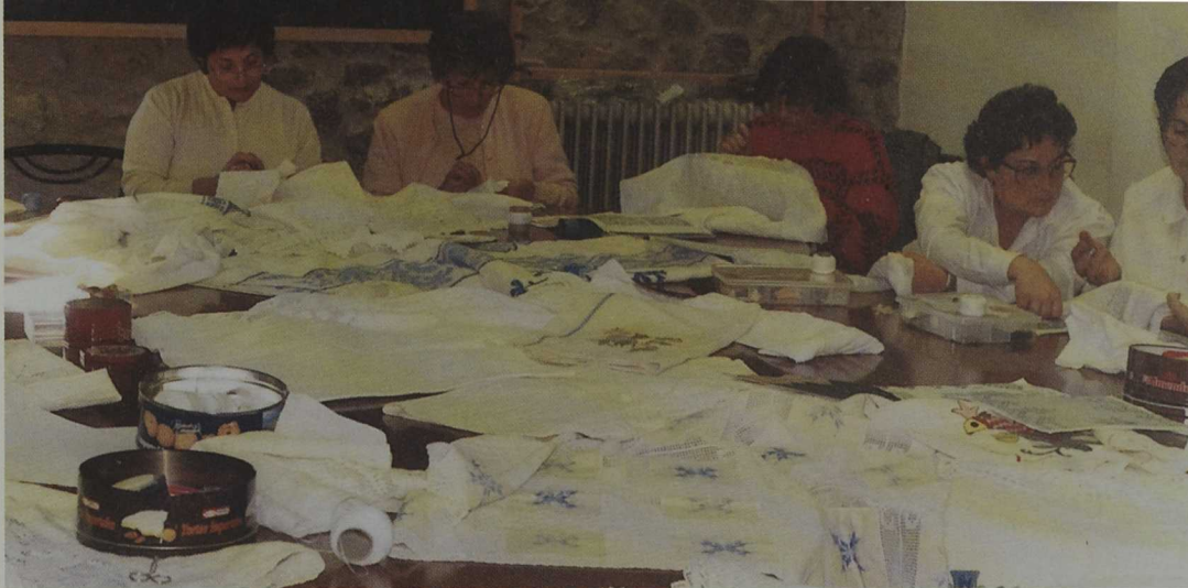
Formación en el Centro de Oficios Artísticos y Turismo Rural de ARTESA (Candelario)

LEADER II en la promoción de actividades en el medio rural; EMPLOI, que incluye la integración laboral de diversos colectivos desfavorecidos, y ADAPT, para los casos de reconversiones y cambios industriales, entre otros.