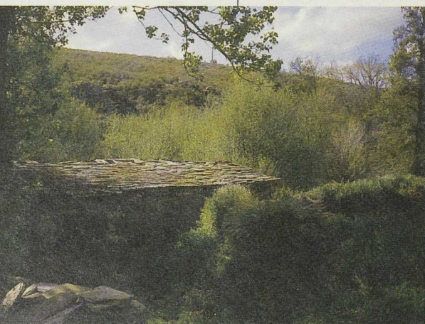
Las comarcas fronterizas comparten arquitecturas y paisajes

A partir de 1997, comenzaron a formalizarse los encuentros, aunque previamente, y fruto de las extraordinarias relaciones entre los Grupos, surgió la Asociación Aulas de Música y Tras os Montes promovidas por personas de ambos lados con objeto de borrar el