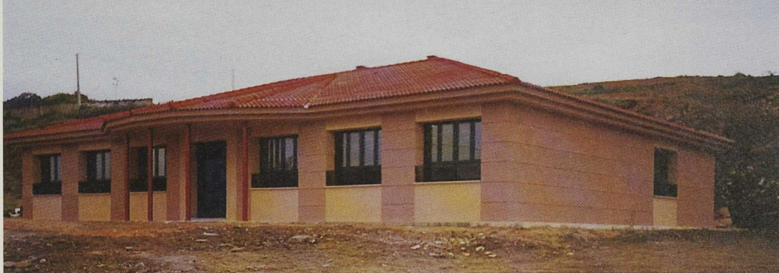
ADATA ha financiado el edificio sede de la Asociación Aulas de Música y Trasmontano en Trabazos.

“efecto frontera” entre dos comarcas hermanas utilizando para ello la música popular del Aliste Trasmontano. Durante años, la Asociación ha promovido encuentros culturales y musicales creando circuitos folklóricos interfronterizos. Los bailes tradicionales, rondas, tonadas y otras melodías reúnen a más de 150 niños y otros tantos adultos que utilizan el lenguaje musical como medio de comunicación social, potenciando con ello Aulas de Música como centro promotor y dinamizador de la cultura tradicional de estas comarcas. ADATA colabora en este proyecto cultural y ha financiado el edificio sede de la Asociación en Trabazos.