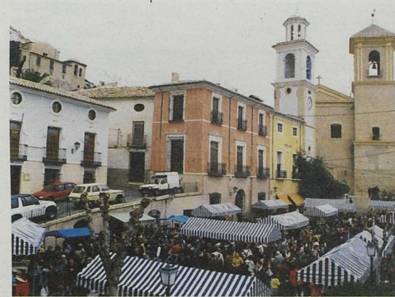
Artesanos de las localidades de Pliego, Albudeite, Campos del Río y Mula convergen en el mercadillo de "Las Cuatro Plazas".

Asociación para el Desarrollo de la comarca Noroeste, Río Mula, Pedanías Altas de Lorca y Sierra Espuña Paraje de la Rafa, s/n. Bullas 30180 Murcia Tel. 968 65 44 34. Fax 968 65 44 00 E-mail: integral@integral.es