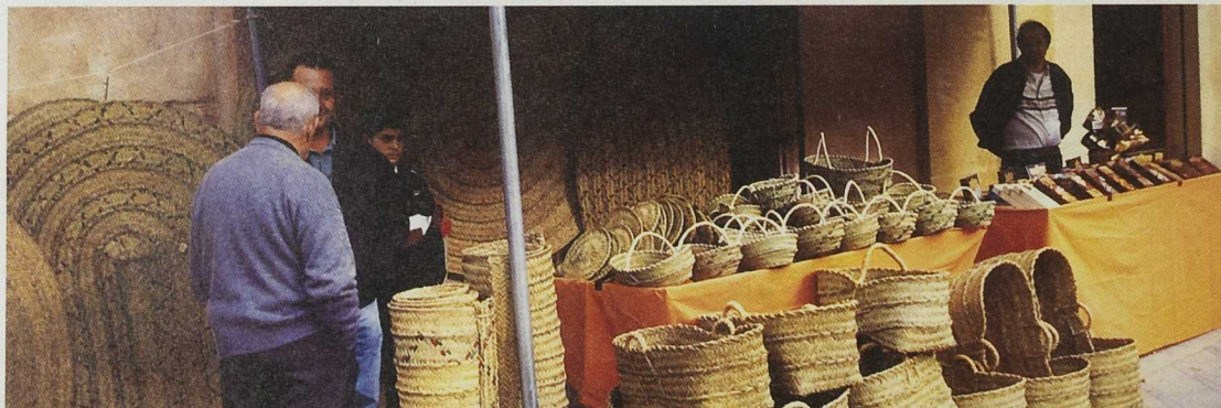
Los mercadillos recuperan lo más genuino y natural de cada comarca