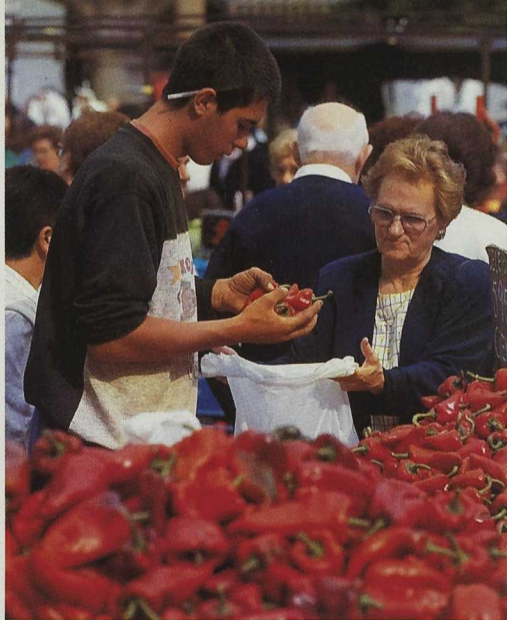
Los productos con denominación de origen son una de las potencialidades de la zona. Mercado de pimientos

ñas obras de infraestructuras que permitan el descanso del paseante y la observación de la riqueza natural de su paisaje.