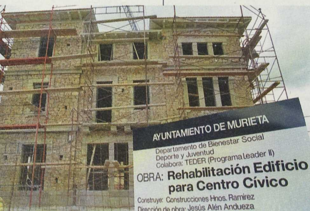
Por iniciativa del Ayuntamiento de Murieta, se ha emprendido la rehabilitación de una de las antiguas estaciones ferroviarias

Nuestra comarca, que aglutina la diversidad biogeográfica y socioeconómica de Navarra, apuesta por la valorización de la zona desde las entidades públicas que, a través de sus iniciativas, generan confianza para invertir y poner en marcha proyectos privados. La recuperación de la vía férrea o la celebración de ferias de productos agroalimentarios son algunos ejemplos.