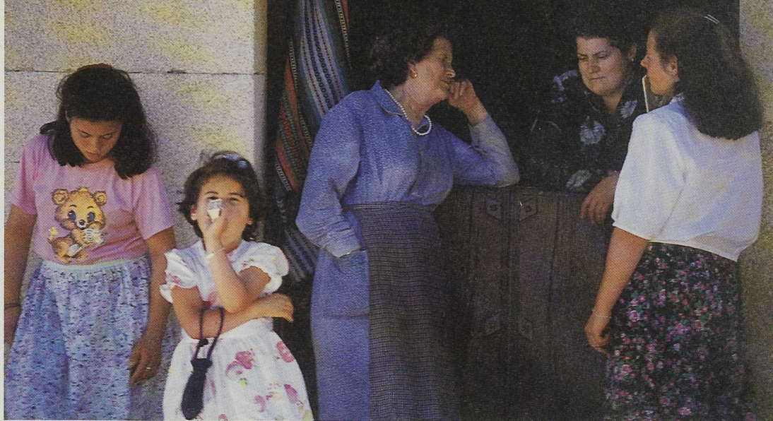
LEADER plus garantiza el protagonismo de los actores sociales

fundamental para el desarrollo de la comarca, o bien para el caso de proyectos interterritoriales”.