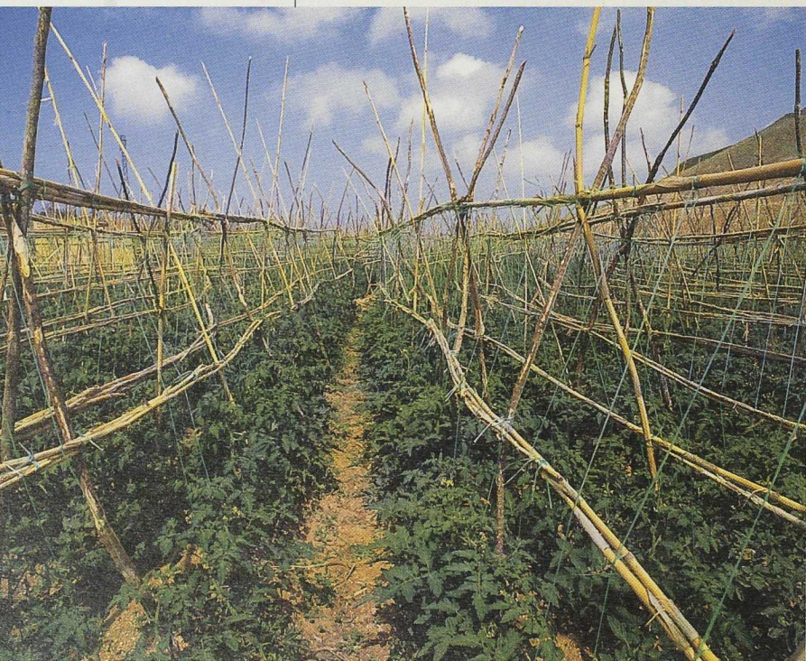
Las relaciones entre agricultura y desarrollo siguen despertando polémica.

Para la Federación de Desarrollo Rural de Castilla La Mancha, el carácter temático debería aplicarse en aquellos territorios en los que ya se han llevado a cabo programas de desarrollo LEADER y PRODER y en la misma opinión incide ARA al considerar que los proyectos temáticos "podrían ser adecuados para aquellas zonas que habiendo sido beneficiadas por LEADER o PRODER hayan alcanzado una fase de consolidación del desarrollo y consideren que existe un sector