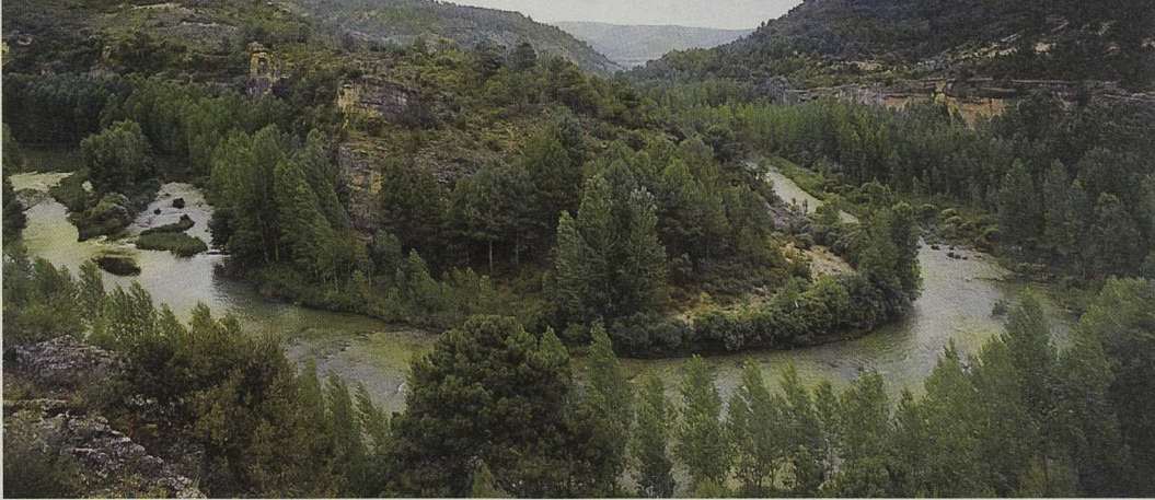
La conservación y mejora del medio ambiente, una de las prioridades.

Para los Programas de Desarrollo Rural, los plazos de presentación de programas son de seis meses desde la aprobación del Reglamento y la Comisión tiene otros seis meses para la Decisión aprobatoria.