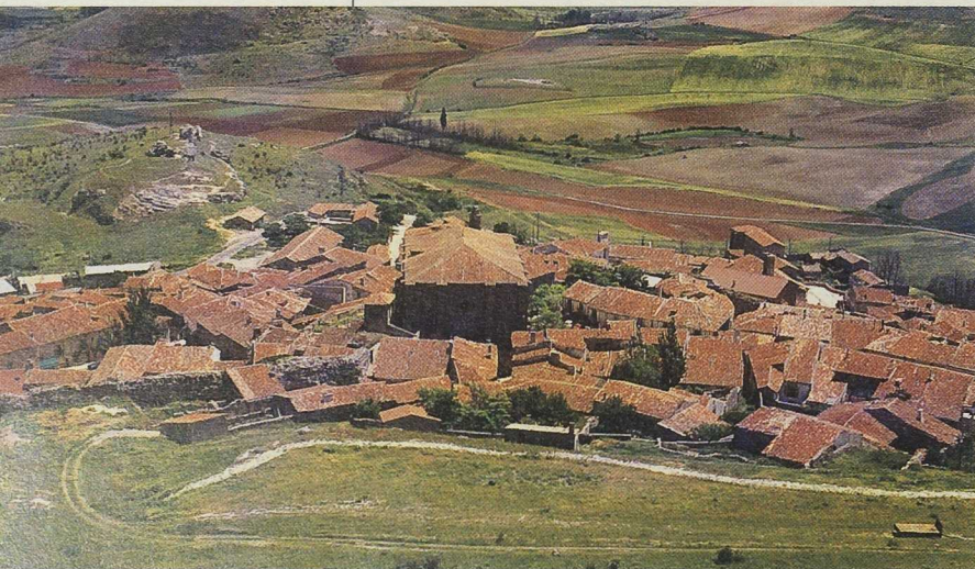
Algunas medidas se orientan a la valorización del patrimonio rural.

Ha de seguir siendo, tal como ha ocurrido en la actual programación, una de las acciones básicas del desarrollo rural, por lo que supone para el incremento del valor añadido de las producciones agrarias, así como para la creación o mantenimiento de puestos de trabajo en el medio rural. Además de las ayudas a las empresas transformadoras se piensa potenciar la línea de comercialización en los aspectos de gestión, mejora y racionalización de canales comerciales y presentación de productos.