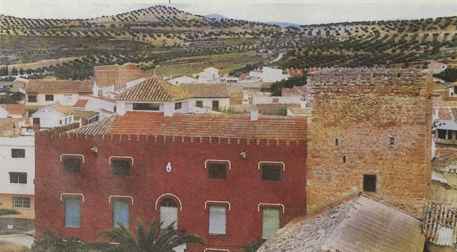
El Poniente jugó un papel estratégico en la defensa del reino nazarí de Granada. Castillo de Moclín

Aunque los contactos se remontan al verano de 1998, es en octubre cuando los Grupos LEADER mantienen el primer encuentro. Reunidos durante siete días en territorio del Poniente, los cinco socios europeos alternaron las mesas de trabajo con la visita a diferentes proyectos LE-