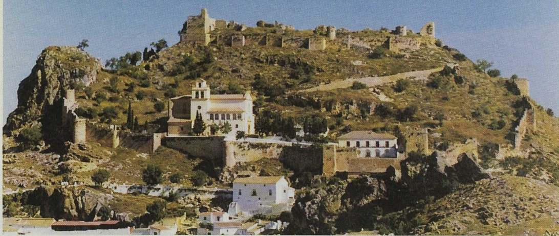
El proyecto incluye la catalogación de los recursos susceptibles de aprovechamiento turístico en las regiones participantes. Castillo de Salar

ADER y localidades de la comarca. Durante estas jornadas los participantes definieron las líneas de actuación a corto plazo y los objetivos del proyecto transnacional. Entre los puntos consensuados destacan: