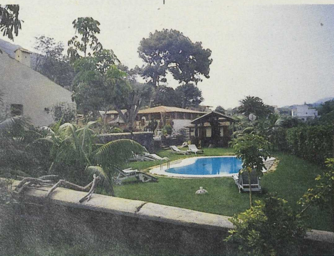
La Federación ha comprometido unos 163 millones de pesetas en la rehabilitación de 24 viviendas de arquitectura tradicional canaria. Alojamiento en Tacoronte

El turismo rural se sitúa en un lugar prioritario dentro de la estrategia del Grupo. Se considera el auténtico motor del proceso de desarrollo local ya que es el sector con mayores potencialidades. La valoración de productos agrarios y la promoción de pymes y empresas artesanas