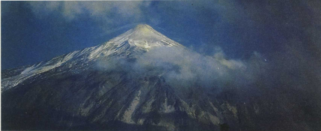
La población rural se localiza fundamentalmente en las medianías de la isla.

se liga en buena medida con el desarrollo de las actividades de turismo temático y éste se vincula también a la rehabilitación del capital ambiental existente en las medianías.