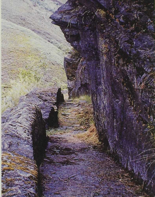
Canal de Las Médulas en el valle del Airoso (Llamas de Cabrera, Benuza)