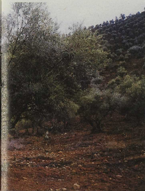
Foto Central: El cultivo del olivar representa una actividad esencial en la comarca

Sociedad de Desarrollo Sierra Morena Cordobesa Vereda, 73. Obejo. 14350 Córdoba Tel. 957 35 02 73. Fax. 957 35 07 43. E-mail: siecor @arrakis.es