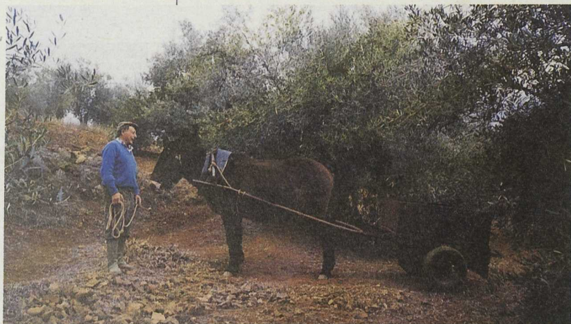
El olivar está siendo cultivado con métodos ecológicos sin renunciar a la rentabilidad económica

La comarca de la Sierra Morena Cordobesa, al norte de la provincia, con una población de 29.341 habitantes y una superficie de 3.179 km 2 , integra ocho municipios -Adamuz, Espiel, Hornachuelos, Montoro, Obejo, Villaharta, Villanueva del Rey y Villaviciosa- de una gran riqueza natural (cuenta con dos Parques Naturales dentro de sus límites) y un extenso patrimonio histórico-artístico.