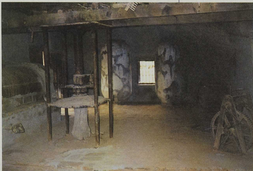
Antiguos molinos de aceite se convertirán en alojamientos rurales, restaurantes o pequeños museos

También a través de dos proyectos de Cooperación Transnacional (Pinhal Maior en Portugal y Bocage Bourbonnais en Francia) y de la Red LEADER Europea, el Grupo de Acción Local ha potenciado la comercialización y la difusión de los productos de la comarca, y en especial de los derivados de la aceituna, en otras zonas de Europa.