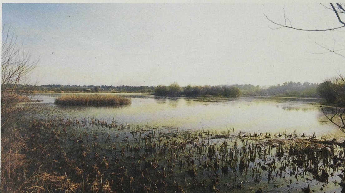
En la laguna de Cospeito se está recuperando un antiguo molino que alojará un centro de interpretación medioambiental

La empresa, de origen vasco y localizada en el Ayuntamiento de Guitiriz, eligió este emplazamiento por la facilidad para adquirir la materia prima -madera roja de eucalipto- y por la existencia de importantes aserraderos que trabajan las maderas autóctonas. En la actualidad produ-