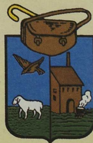
Escudo de Villoslada de Cameros con motivos pastorales