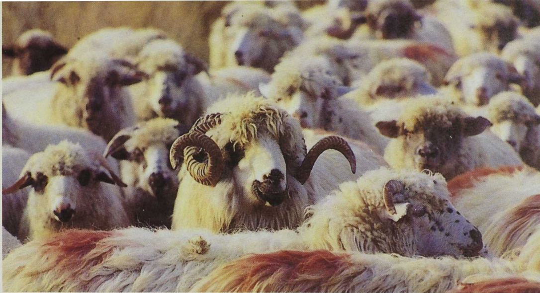
Más de un millón de cabezas de ganado sigue desplazándose por nuestras cañadas

realizado con la Asociación ecologista ASDEN un estudio sobre las posibilidades de la cañada Soriana Occidental.