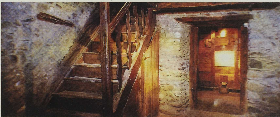
El Ecomuseu de les Valls d'Àneu incluye espacios y edificios repartidos por todo el valle

CEDER Pallars Pau Casals, 14. Tremp. 25620 Lleida Te: 973 65 08 13. fax: 973 65 28 31. E-mail: pallars@telcom.es