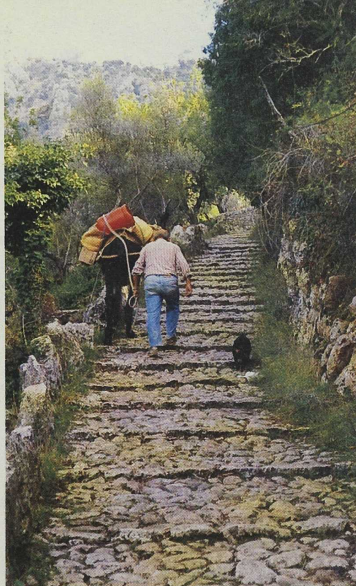
El Barranco de Biniaraix, uno de los restaurados dentro del programa LEADER.

queda expuesta a las inclemencias climatológicas, fundamentalmente al agua y al viento, lo que origina un deterioro definitivo por causa de la erosión.