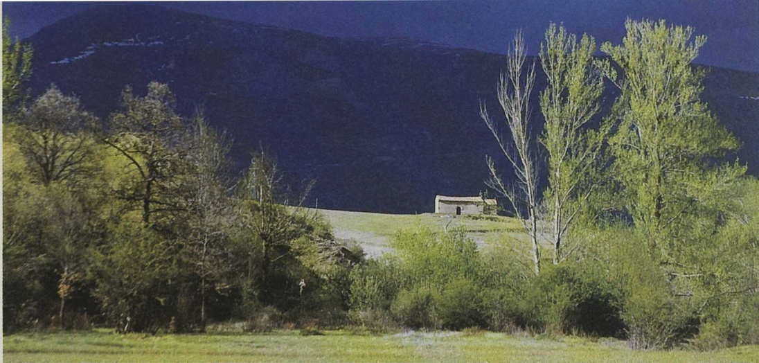
La oferta turística incluye también grupos organizados de educación ambiental.

con la complicidad y autorización de los responsables de Medio Ambiente de la administración regional.