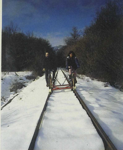
Montaña Palentina coordina un proyecto para la reutilización de vías férreas abandonadas.

Monegros ha recibido ya el visto bueno del Observatorio Europeo para un proyecto de cooperación -"Patrimonio y Agro-industria"- con el LEADER francés de los Altos Pirineos. Por estar en fase de ejecución, requieren mención aparte los Proyectos A Raia - La Raya, ejemplo de cooperación transfronteriza ampliamente descrito en el primer número de Actualidad Leader, Paralelo 40 y Vía Mediterránea.