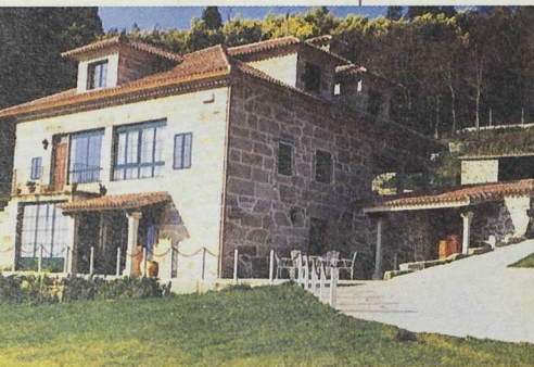
La estrategia de desarrollo de la mayoría de los programas se centra principalmente en el Turismo Rural. Alojamiento en Barcela-Arbo

- Estamos además en una de las regiones más afectadas por las restricciones impuestas desde la entrada de España en la U.E.: el ganado de leche y carne se ha visto obligado a una severa reestructuración aún sin finalizar; lo mismo podemos decir de la pesca; uno de los sectores industriales punteros de Galicia como el naval se enfrenta a múltiples dificultades. Los puestos de trabajo que se están perdiendo solamente en los sectores citados son una continua sangría que no nos podemos permitir. Los sectores a los que se intenta derivar este personal todavía no están lo suficientemente estabilizados.