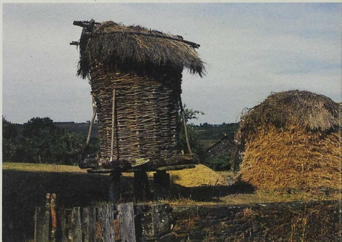
Muchas de las explotaciones gallegas carecen de la dimensión y adecuación necesarias para ser viables.