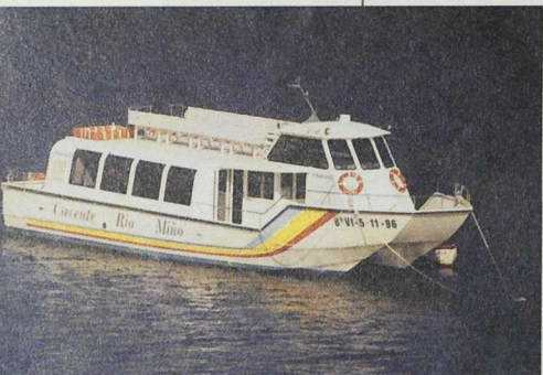
Algunas iniciativas explotan las posibilidades de los recursos naturales. Rutas fluviales por el Miño