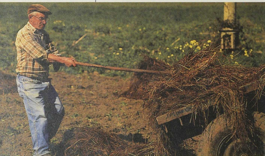
La sociedad rural gallega está basada en unas estructuras ancestrales y es, en general, poco ágil.

De todas formas, estamos solamente en el LEADER II; seguramente para el LEADER VII ó VIII (o cualquiera otro nombre que estos programas reciban) todos estos problemas e inquietudes se habrán superado y si seguimos en la línea actual de trabajo y dedicación nuestro medio rural recogerá los frutos de esta semilla. ■