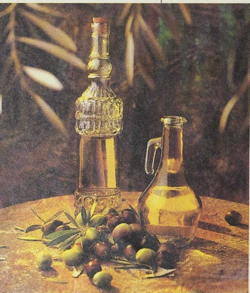
Las inversiones realizadas en todas las fases de producción han mejorado la calidad del aceite de oliva

En cuanto a la comercialización de estos productos y de los agroalimentarios en general -sin olvidar el turrón, embutidos, vinos, cordeiro-, hay que mencionar las acciones encaminadas a una mejor presentación, envasado, etiquetado, edición de catálogos, etc.