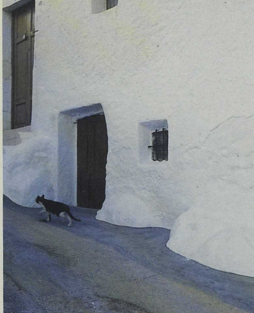
Algunas acciones se dirigen a la restauración arquitectónica en el patrimonio popular.

La modernización y creación de empresas que transformen, comercialicen, distribuyan y mejoren la calidad de los productos locales y tradicionales son algunas de las acciones que apoya esta medida destinada a promocionar y revalorizar el potencial productivo agrario y forestal de nuestras zonas rurales.