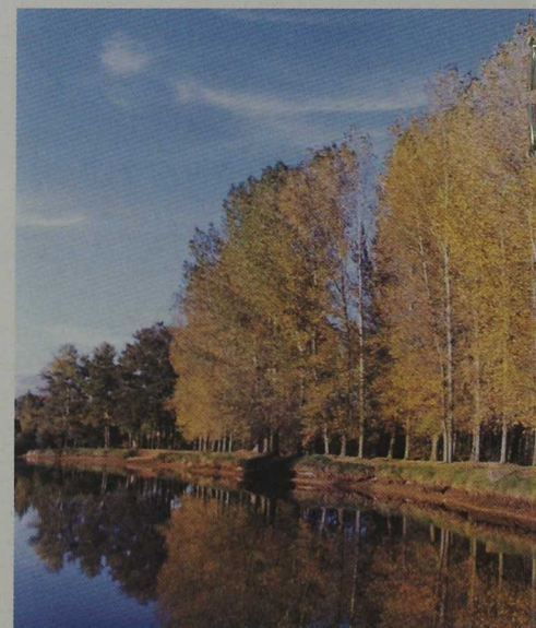
El río Duero a su paso por la