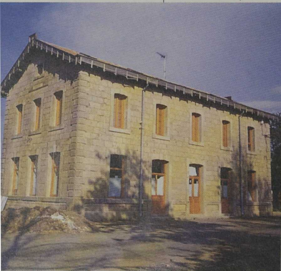
Casa rural en la vieja estación de Morón

En un primer momento, los proyectos de establecimientos de turismo rural surgieron de forma esporádica y desorganizada, pero siempre con una visión empresarial y de negocio que debe caracterizar cualquier actividad eco-