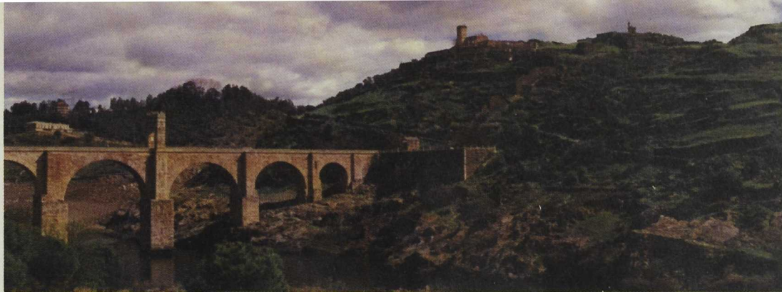
Se crearán rutas ligadas al medio ambiente como las que se articulan en torno al río Tajo. Puente de Alcántara

una base de datos con información turística preferentemente multimedia y sistemas de intercambio electrónico de datos. El objetivo es divulgar conjuntamente las ofertas de turismo rural y de los recursos patrimoniales con potencial turístico.