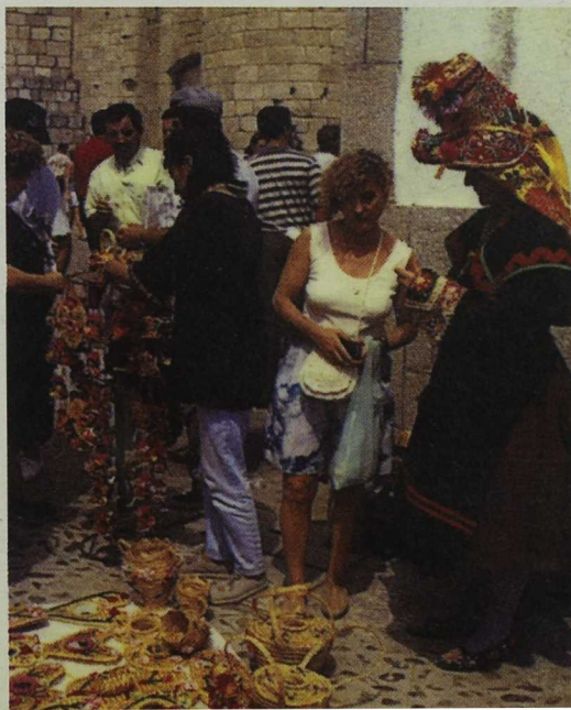
La Feria rayana ha contribuido a fortalecer el intercambio cultural y a promocionar los productos de las comarcas

Con la edición de este año, que tendrá lugar a finales de septiembre en Moraleja (Sierra de Gata), son ya seis las celebradas al amparo del Protocolo de Cooperación Transfronteriza. Todas han contribuido a fortalecer el intercambio socio-cultural, a promocionar y divulgar el patrimonio, las artesanías, los productos locales, el folklore y las costumbres de las comarcas rayanas ■