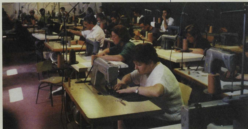
Un curso de formación preparó a los futuros trabajadores de la empresa textil