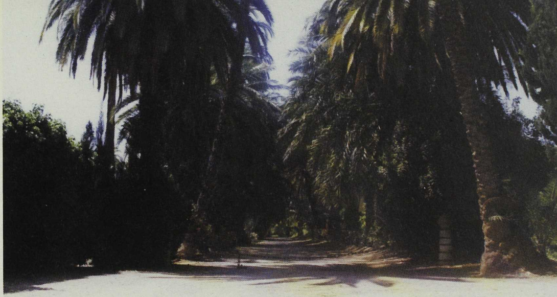
El Parque, en el término de Ulea

Denominado en algunos folletos turísticos como "valle morisco", seguramente porque el valle de Ricote fue el último reducto de los moriscos del Reino de Murcia, conserva aún un cierto aire oriental en los huertos y en los infinitos campos de naranjos y limoneros.