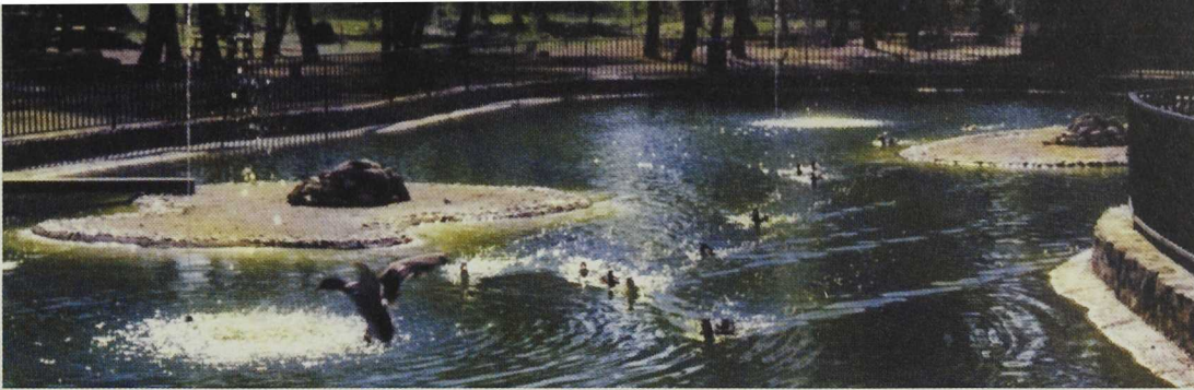
En el Parque de Talayuela se instalará un acuario para las especies de agua dulce de la región.

versos proyectos. Entre ellos, los de mayor relevancia son los que se dirigen al apoyo de pequeñas empresas, artesanía y servicios; turismo y valorización de la producción agraria.