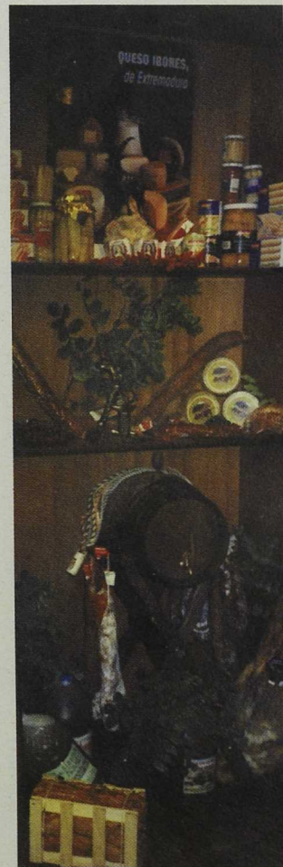
A las muestras han acudido unos 300 empresarios de industrias agroalimentarias y artesanales extremeñas

Finalmente, otras iniciativas se han dirigido a inventariar y catalogar el patrimonio histórico y arqueológico de la comarca, para su posterior rehabilitación, y que servirá como base documental a los folletos editados para la promoción de la comarca ■